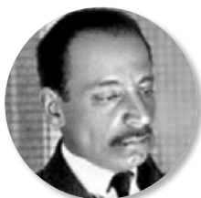
Rainer Maria Rilke

Evangelische Kirche Gangelt, Lohausstr. 36