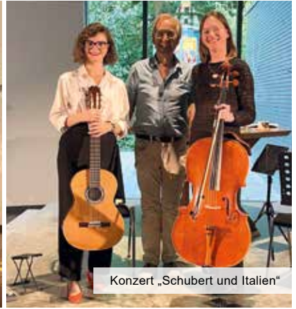
Konzert „Schubert und Italien“